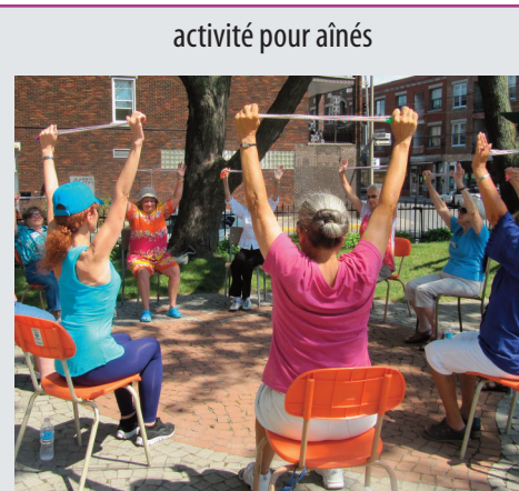
activité pour aînés

Cette rubrique peut être l'occasion de mettre une photo et ou une illustration, etc. L'espace restreint oblige l'aîné rédacteur à un effort intellectuel de synthèse.