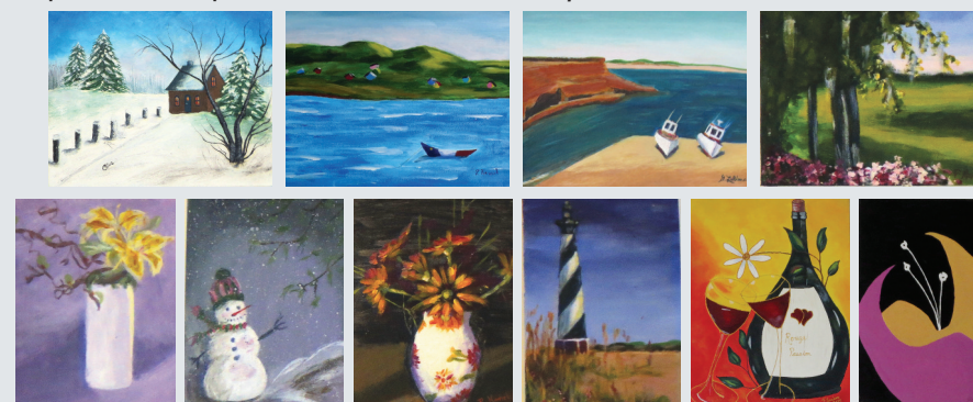
Différentes peintures réalisées par des « élèves aînés » • Exposition jusqu'au 18 septembre 2015

24 artistes (professeurs et élèves) 23 peintures en exposition